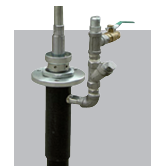
Bomba bicomponente preto