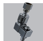
Dispositivo de engate universal (aço inoxidável)