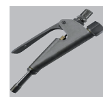
Pistola de aplicação Uso vertical