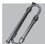
Mixer bicomponente aço inoxidável