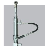
Bomba dosagem bicomponente