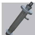
Bomba bicomponente branco