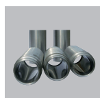
Camisa do cilindro da bomba aço forjado