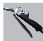
Pistola de aplicação uso horizontal e < até 45%